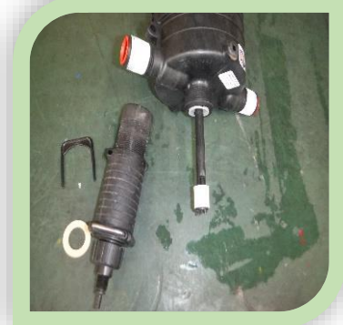
作動音はするが、液肥を吸い込まない。