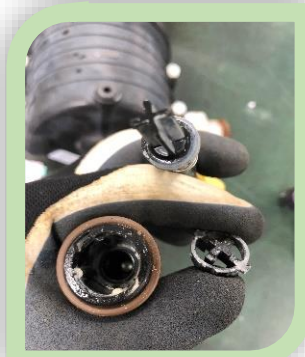
液肥の吸い上げが悪い